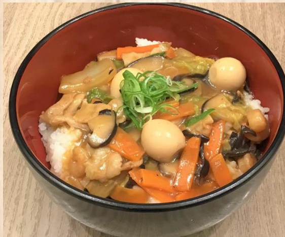
Japanese-Chinese Style Meat Platter with Rice