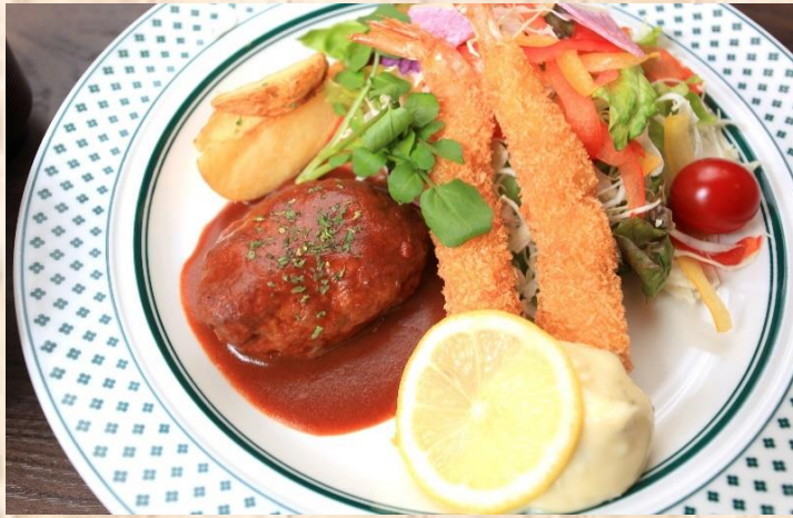
Hamburger Steak & Fried Shrimp