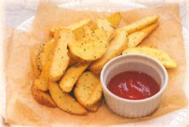
French Fries 揚げたてポテトフライ ¥550(税込)