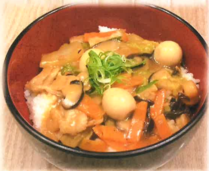
Chinese Donburi 中華丼 ¥880(税込)