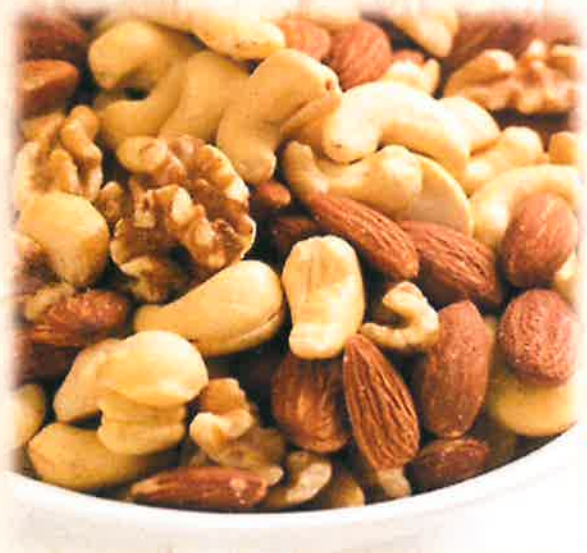
Mixed nuts ミックスナッツ ¥350(税込)