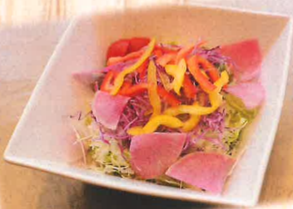
Mixed Salad きまぐれサラダ ¥550(税込)