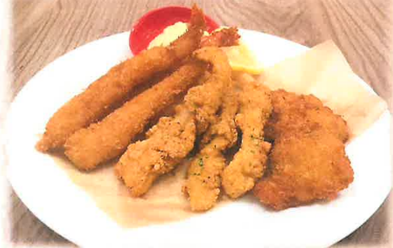
Mixed Fried ミックスフライ ¥1200(税込)